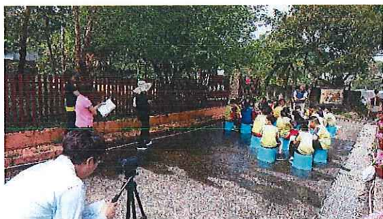
圖三：教師觀課準備