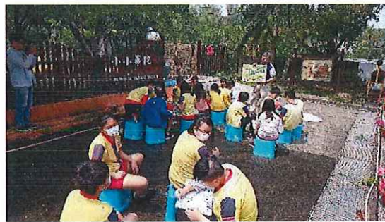
圖四：老師公開觀課中