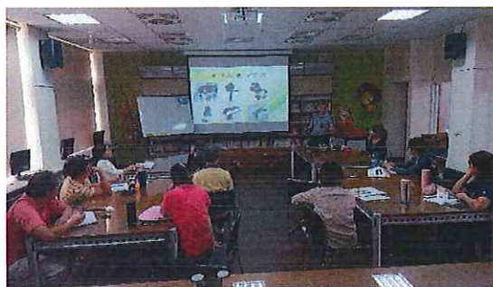
圖二：夥伴老師各類行動學習工具