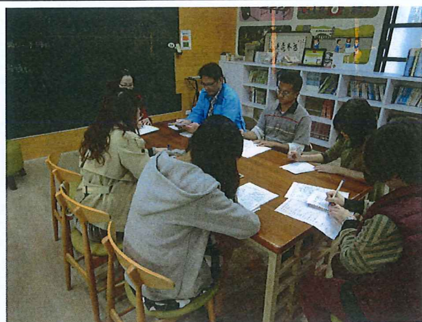
圖一：108.10.16 PSI 介紹