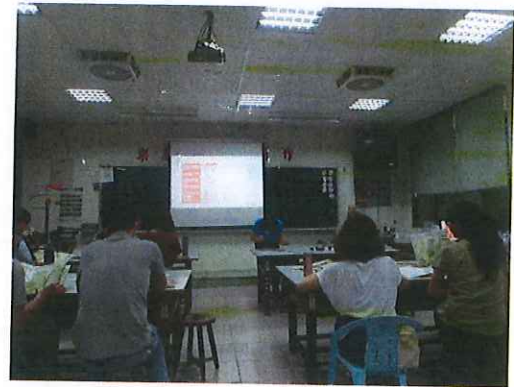
圖四：〈教專社群專業共學-班級閱讀教學推動實務〉