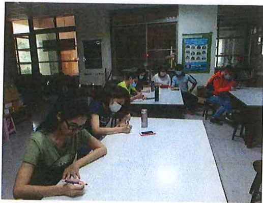
圖三：〈教專社群專業共學-跨域協作教學〉