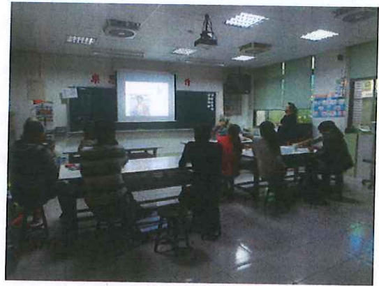
圖二：〈『美人尖』讀後感及其應用教學上的教案分享〉