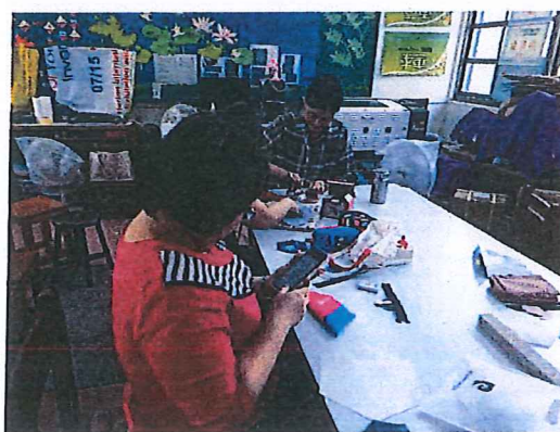
圖六：完成理論與實作的結合作品