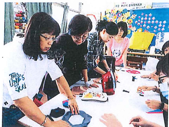
圖三：講師耳提面命深怕一步錯毀全盤