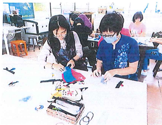
圖二：實作與討論中認真的學員