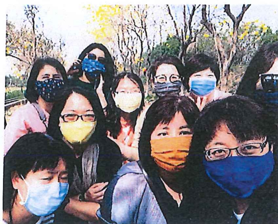
圖四：配合防疫自行製作的布口罩